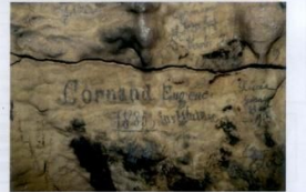
Journée familiale à la grotte de la Fétouère