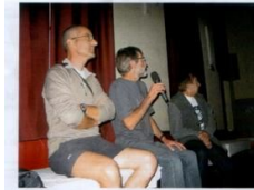
Soirée Spéléo - Ph. Bertochio, E. Baudet, F. Poggia