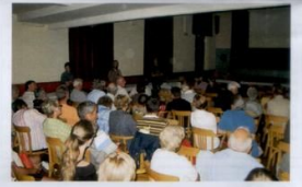
Soirée Spéléo - Un public nombreux et passionné